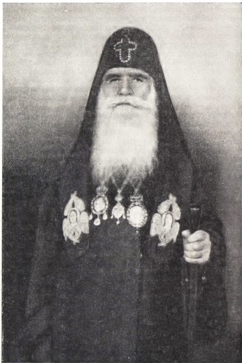
КАТОЛИКОС-ПАТРИАРХ ВСЕЯ ГРУЗИИ МЕЛХИСЕДЕК